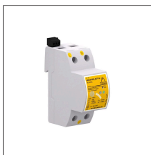
AT-8704 ATCONTROL/B PT-M