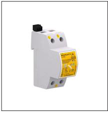
AT-8703 ATCONTROL/B P-M