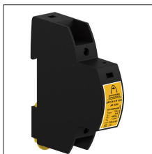
AT-8200 ATSUB-D M 1DIN