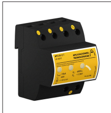
AT-8217 ATSUB-D T