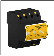
AT-8217 ATSUB-D T