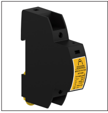
AT-8200 ATSUB-D M 1DIN