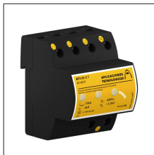
AT-8217 ATSUB-D T