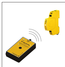
AT-3501 RF SPD TESTER