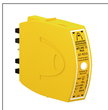
AT-9231 ATLINE 30 Mod.