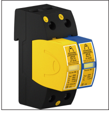
AT-8026 ATSUB-2P-NR 65 TT