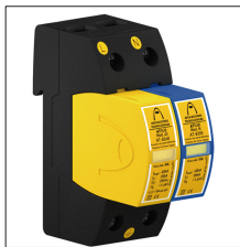
AT-8026 ATSUB-2P-NR 65 TT