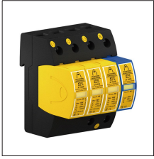
AT-8036 ATSUB-4P-NR 65 TT