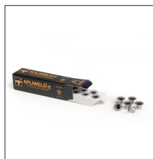
AT-010N Apliweld®-E. Iniciador electrónico 10ud