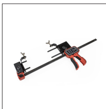
AT-051N Pinza moldes conductores en vertical