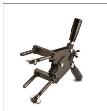
AT-049N Pinza modelo S para moldes específicos