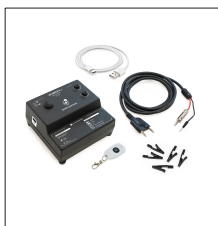
AT-200N Kit Apliweld®-E v.3: Kit de encendido electrónico