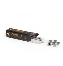
AT-010N Apliweld®-E. Iniciador electrónico 10ud