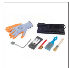
AT-069N Set de accesorios básicos Apliweld®-E