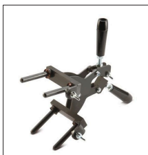
AT-050N Pinza modelo G para moldes específicos