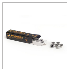
AT-010N Apliweld@-E. Iniciador electrónico 10ud