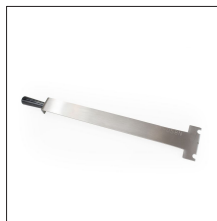
AT-058N Accesorio soldadura horizontal