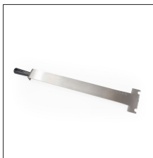
AT-058N Accesorio soldadura horizontal