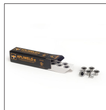
AT-010N Apliweld®-E. Iniciador electrónico 10ud