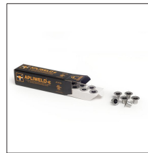
AT-010N Apliweld@-E. Iniciador electrónico 10ud