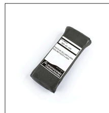
AT-065N Pasta de sellado 0,45kg