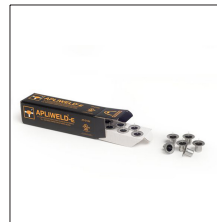
AT-010N Apliweld®-E. Iniciador electrónico 10ud