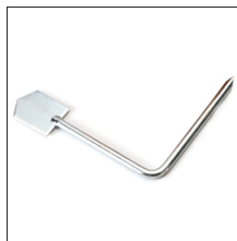
AT-117N Paleta rascamoldes para moldes Grandes