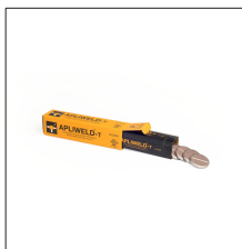
AT-021N Apliweld@-T. 20 tabletas soldadura ø55mm