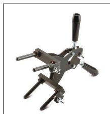
AT-050N Pinza modelo G para moldes específicos