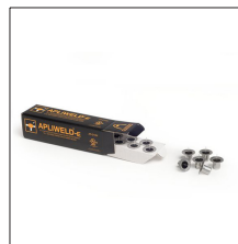
AT-010N Apliweld®-E. Iniciador electrónico 10ud