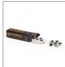
AT-010N Apliweld®-E. Iniciador electrónico 10ud