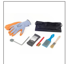
AT-069N Set de accesorios básicos Apliweld®-E