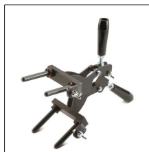
AT-050N Pinza modelo G para moldes específicos