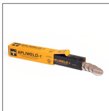
AT-020N Apliweld®-T. 20 tabletas soldadura ø43mm