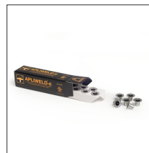
AT-010N Apliweld®-E. Iniciador electrónico 10ud