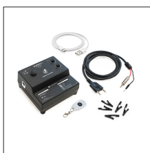
AT-200N Kit Apliweld®-E v.3: Kit de encendido electrónico