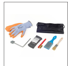
AT-069N Set de accesorios básicos Apliweld®-E