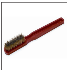
AT-062N Cepillo limpieza tolva y tapa inic.elec