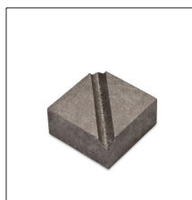
MM-PH Pieza inferior MM para cable/paletina