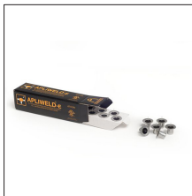
AT-010N Apliweld®-E. Iniciador electrónico 10ud