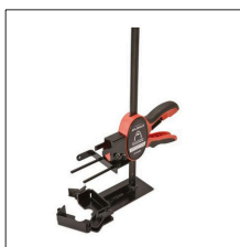
MM-053N Pinza molde múltiple