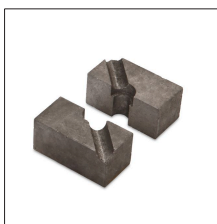
MM-PT16 Pieza inferior para pica de ø16 mm