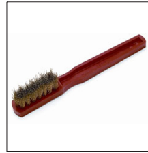
AT-062N Cepillo limpieza tolva y tapa inic.elec