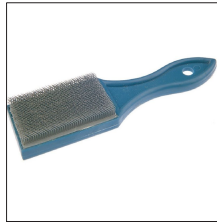
AT-061N Cepillo limpieza conductores