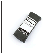
AT-065N Pasta de sellado 0,45kg