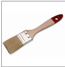
AT-064N Pincel limpieza cámara