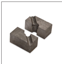
MM-PT18 Pieza inferior para pica de ø18,3 mm