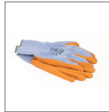
AT-073N Guantes de seguridad