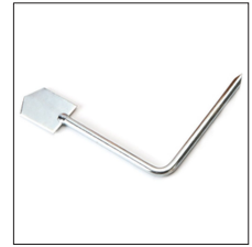
AT-063N Paleta rascamolde