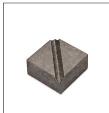
MM-PH Pieza inferior MM para cable/pletina