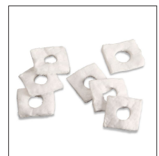
MM-CS Sellador Cámara (60 unidades)