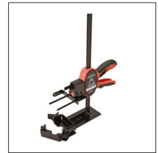
MM-053N Pinza molde múltiple