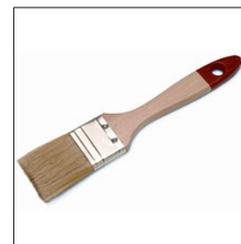
AT-064N Pincel limpieza cámara