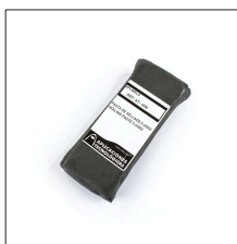
AT-065N Pasta de sellado 0,45kg