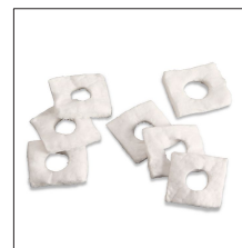
MM-CS Sellador Cámara (60 unidades)