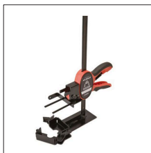
MM-053N Pinza molde múltiple