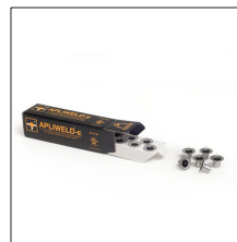
AT-010N Apliweld®-E. Iniciador electrónico 10ud