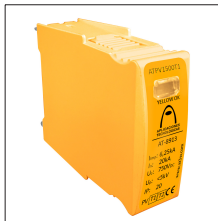
AT-8910 ATPV500 Mod. (Uc = 500V) I max = 75kA