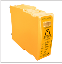
AT-8911 ATPV750 Mod. (Uc = 750V) Imax = 75kA