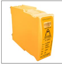
AT-8912 ATPV500T1 Mod. (Uc = 500V) Iimp = 6,25kA